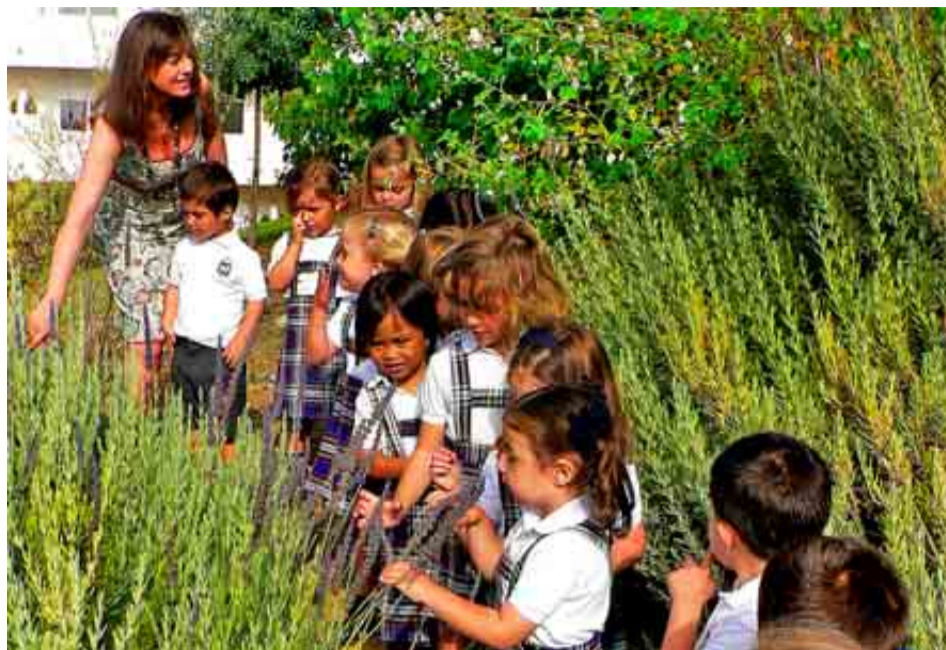
COLEGIO PATROCINIO SAN JOSÉ DE MÁLAGA

Puntuación: Total: 81/100. Grupo A: 31/39. Grupo B: 29/34. Grupo C: 21/27.