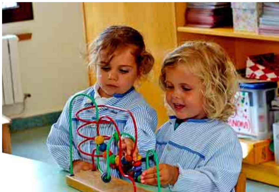
COLEGIO LA MIRANDA DE BARCELONA

PUNTAJACIÓN: Total: 85/100. Grupo A: 31/39. Grupo B: 30/34. Grupo C: 24/27.