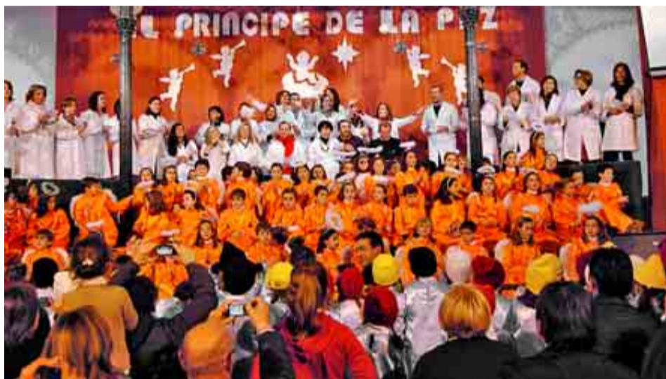
COLEGIO CLARET DE BADAJOZ

PUNTUACIÓN: Total: 86/100. Grupo A: 34/39. Grupo B: 29/34. Grupo C: 23/27.