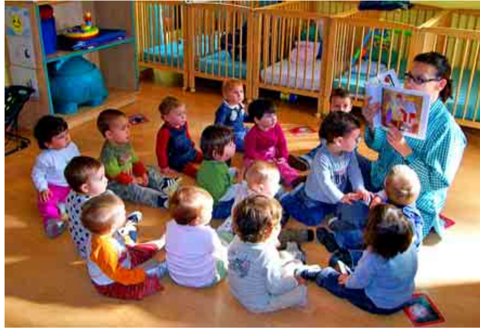
COLEGIO VIROLAI DE BARCELONA

PUNTAJÓN: Total: 80/100. Grupo A: 30/39. Grupo B: 29/34. Grupo C: 21/27.