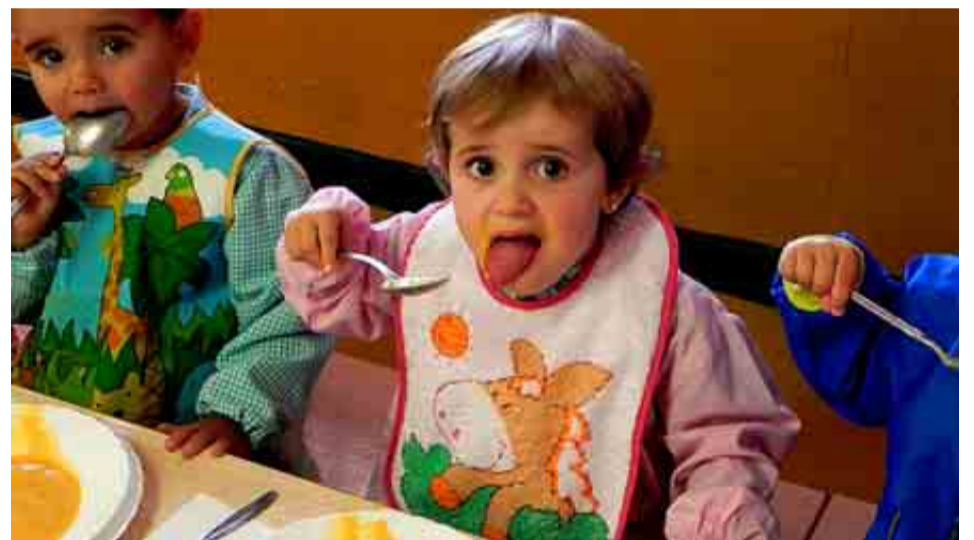
COLEGIO BEGOÑAZPI DE VIZCAYA