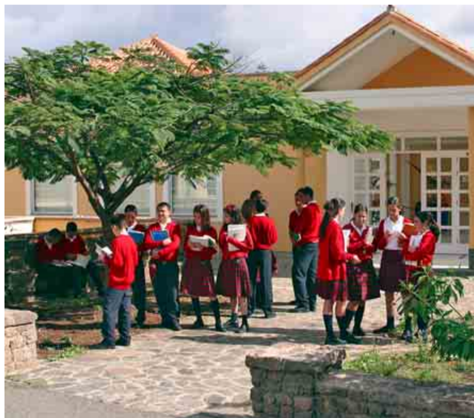
COLEGIO ARENAS DE GRAN CANARIA