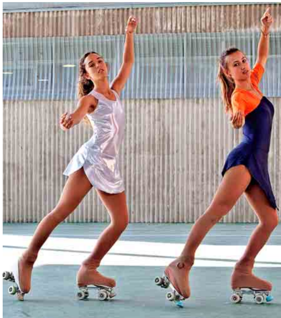
COLEGIO BERNADETTE DE MADRID

El King's College es pionero en educación británica en nuestro país y cuenta con tres centros en la Comunidad de Madrid: uno en Soto de Viñuelas (3 a 18 años) –que dispone de una residencia de estudiantes recién inaugurada con capacidad para 40 personas–, otro en La Moraleja (3 a 14 años) y el último en Chamartín (de 3 a 6 años). Algunas de las mejores universidades del mundo como Yale, Oxford y Cambridge cuentan con antiguos alumnos de este colegio en sus aulas.