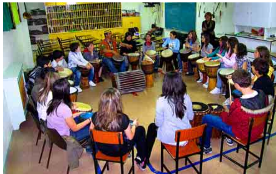
COLEGIO VIZCAYA DE VIZCAYA

Puntuación: Total: 96/100. Grupo A: 38/39. Grupo B: 33/34. Grupo C: 25/27.