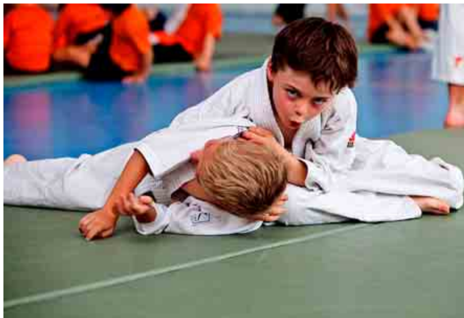
COLEGIO BERNADETTE DE MADRID

PUNTUACIÓN: Total: 85/100. Grupo A: 31/39. Grupo B: 32/34. Grupo C: 22/27.