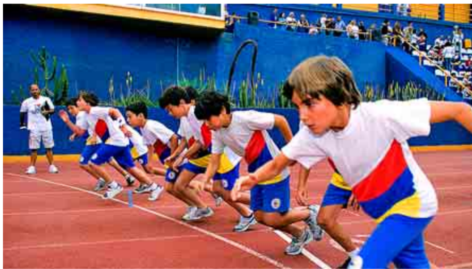
COLEGIO HEIDELBERG DE GRAN CANARIA

Puntuación: Total: 89/100. Grupo A: 34/39. Grupo B: 31/34. Grupo C: 24/27.