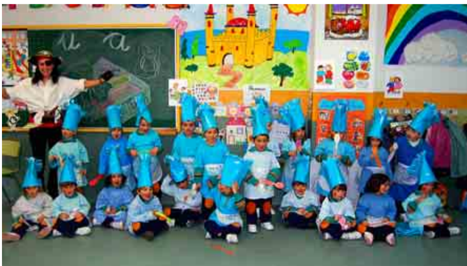
COLEGIO LUYFERIVAS DE MADRID

Puntuación: Total: 81/100. Grupo A: 28/39. Grupo B: 28/34. Grupo C: 25/27.