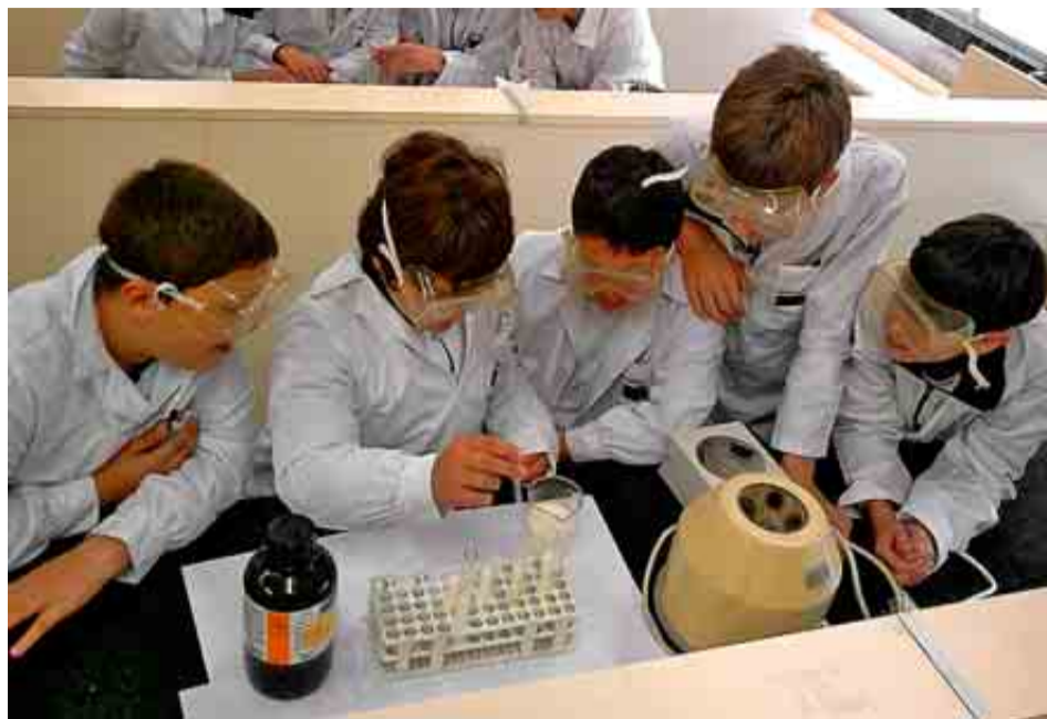
COLEGIO INTERNACIONAL NUEVO CENTRO DE MADRID

PUNTUACIÓN: Total: 89/100. Grupo A: 33/39. Grupo B: 31/34. Grupo C: 25/27.