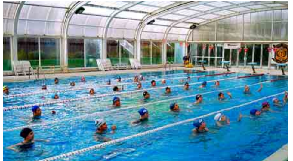
COLEGIO BRAINS DE MADRID

PUNTAJACIÓN: Total: 90/100. Grupo A: 34/39. Grupo B: 31/34. Grupo C: 25/27.