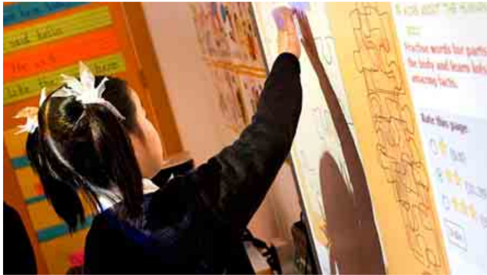
COLEGIO SEK EL CASTILLO DE MADRID

PUNTAJACIÓN: Total: 94/100. Grupo A: 37/39. Grupo B: 33/34. Grupo C: 24/27.