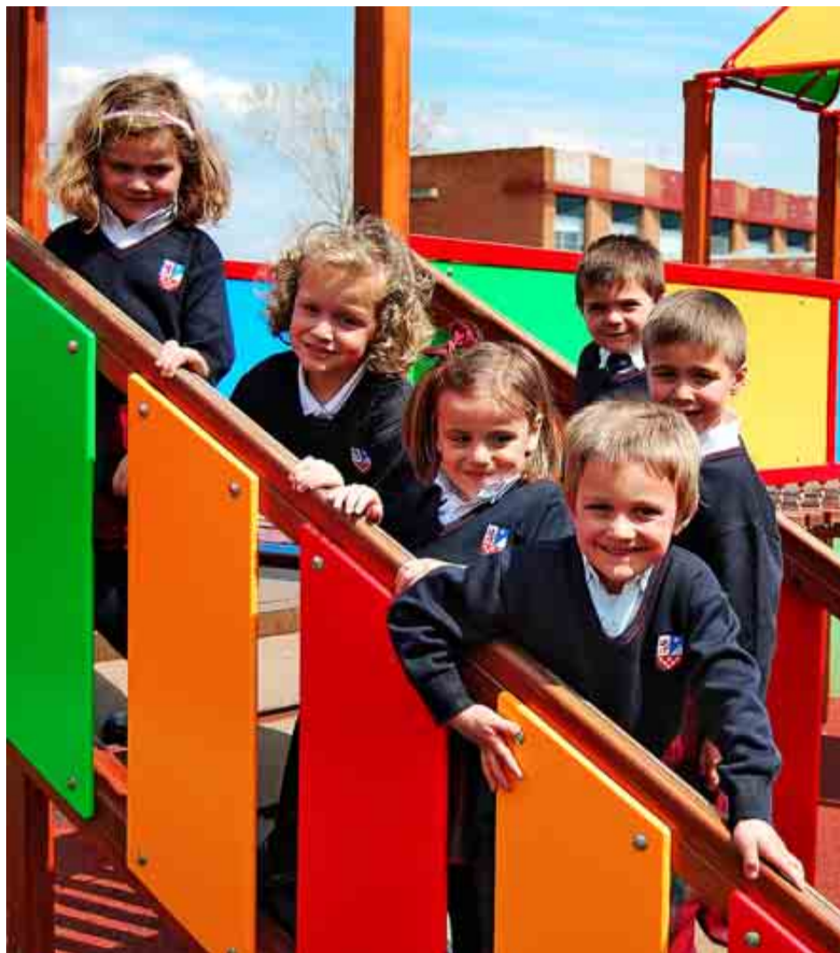
COLEGIO INTERNACIONAL PEÑACORADA DE LEÓN

Los alumnos siguen un programa de estudios diseñado con la intención de asegurar que todos tengan la oportunidad de triunfar en sus estudios, independientemente de sus capacidades. Crean en la importancia de una educación integral a través de una amplísima gama de actividades extraescolares –arte, música, teatro, deporte, asociaciones, trabajo comunitario– y en el papel fundamental que tiene el colegio en el desarrollo emocional de los escolares.