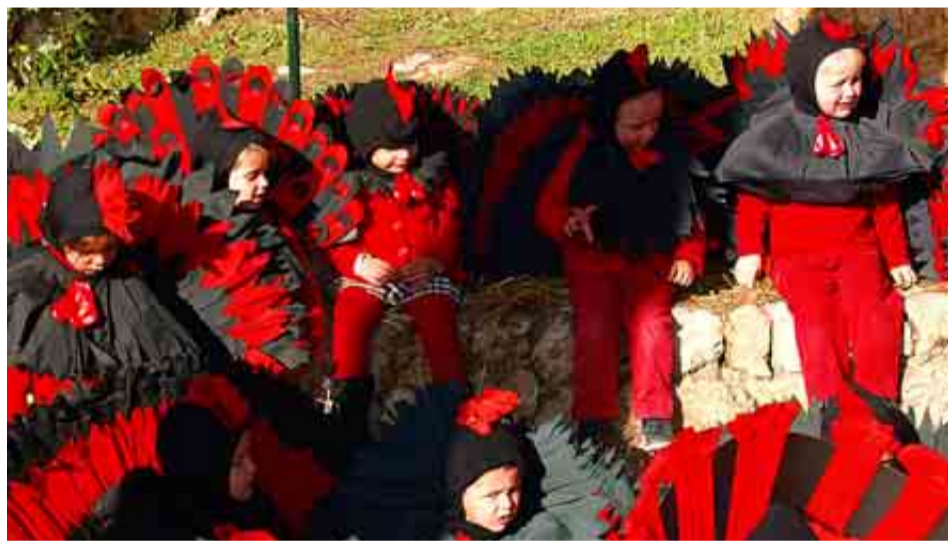
COLEGIO SAN CAYETANO DE MALLORCA

Puntuación: Total: 81/100. Grupo A: 30/39. Grupo B: 30/34. Grupo C: 21/27.