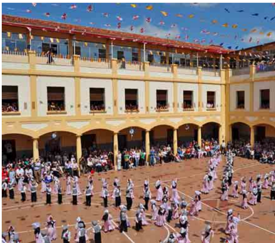
COLEGIO BLANCA DE CASTILLA DE PALENCIA

PUNTAJACIÓN: Total: 76/100. Grupo A: 30/39. Grupo B: 25/34. Grupo C: 21/27.