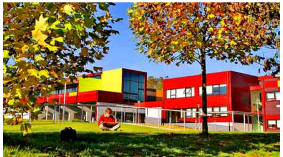
COLEGIO PELETEIRO DE A CORUÑA