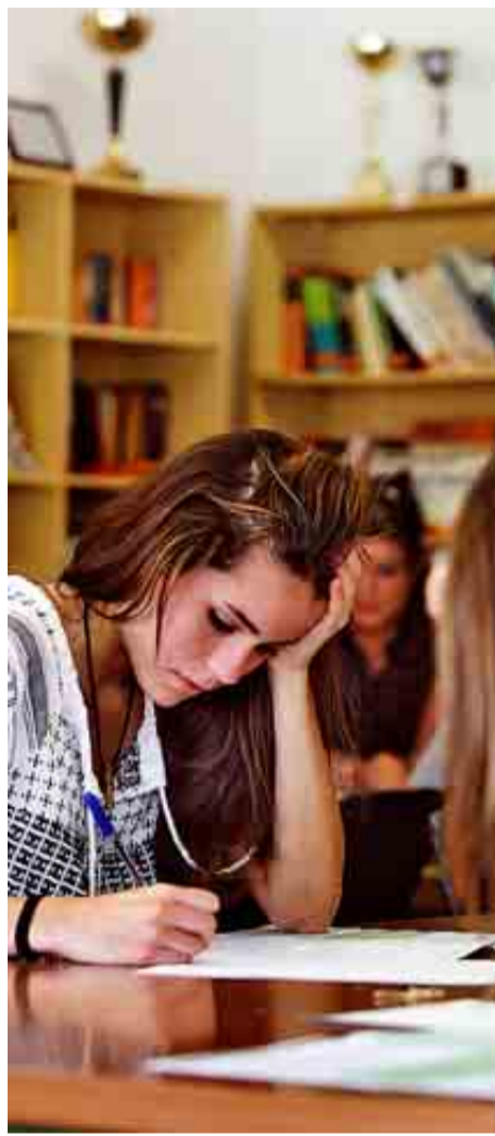
COLEGIO HEIDELBERG DE GRAN CANARIA

PUNTAJACIÓN: Total: 79/100. Grupo A: 28/39. Grupo B: 29/34. Grupo C: 22/27.